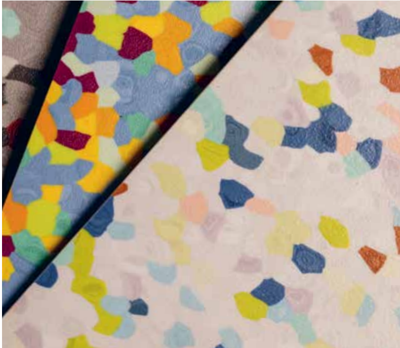
HOMOGENER VINYLBELAG «FABSCRAP»