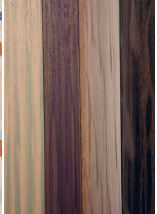
VINYL-DESIGNFLIESEN «ALLURA FUSION»